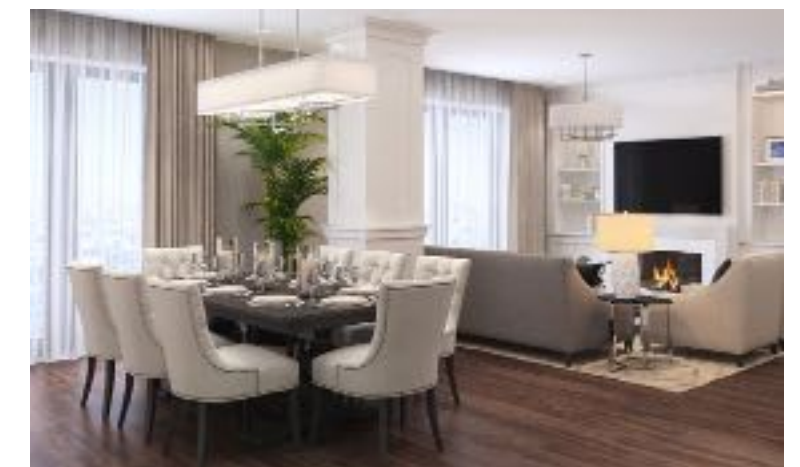
Дизайн-проект интерьера в элитном квартале «Сады Пекина»

ставительские пентхаусы, откуда вся Москва видна как на ладони. Сами владельцы апартаментов, напротив, остаются недосягаемыми для взора. Для проветривания помещения там предусмотрены специальные открывающиеся элементы – в дополнение к вентиляции и центральному кондиционированию, за чистотой окон бдительно следит управляющая компания. А хозяевам лишь остается наслаждаться самым лучшим видом на город