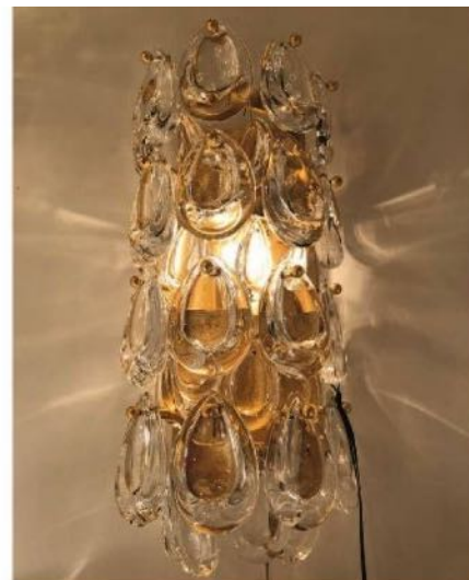
БРА AERIN, VISUAL COMFORT & CO.